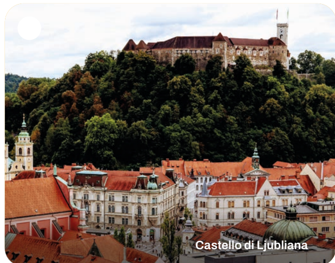
Castello di Ljubiana