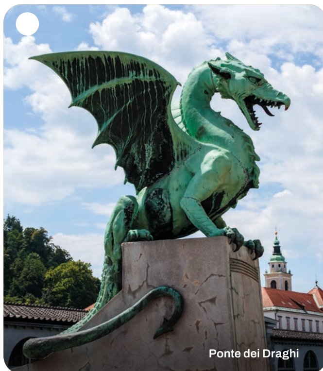
Ponte dei Draghi