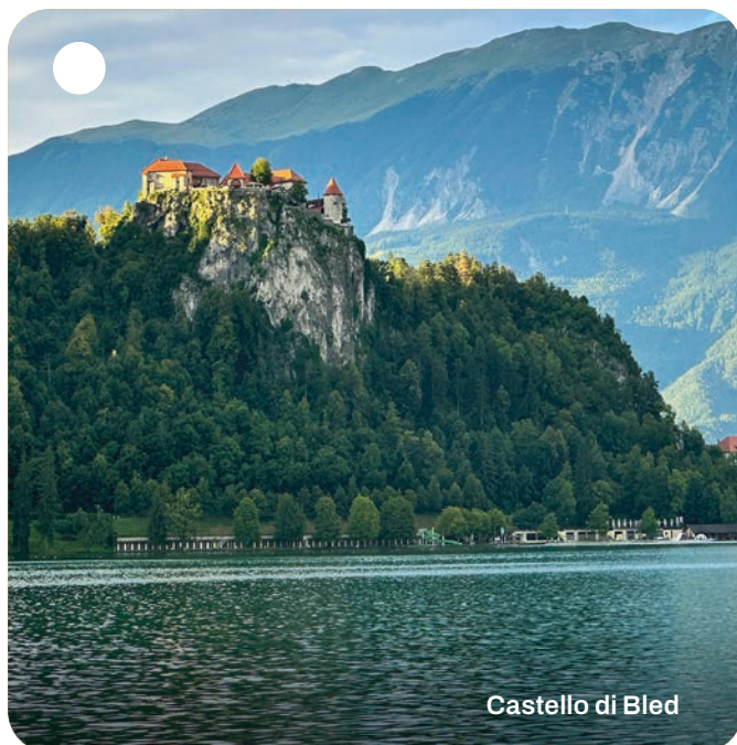
Castello di Bled