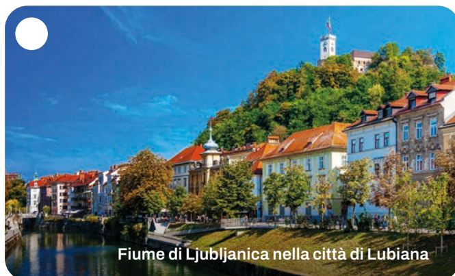
Fiume di Ljubljanica nella città di Lubiana