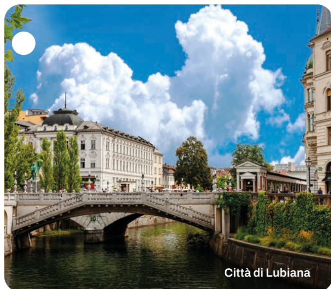
Città di Lubiana