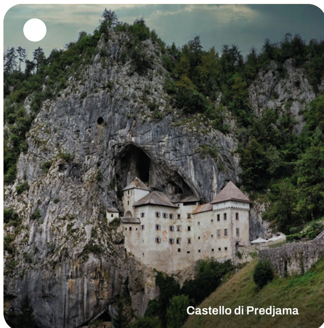
Castello di Predjama