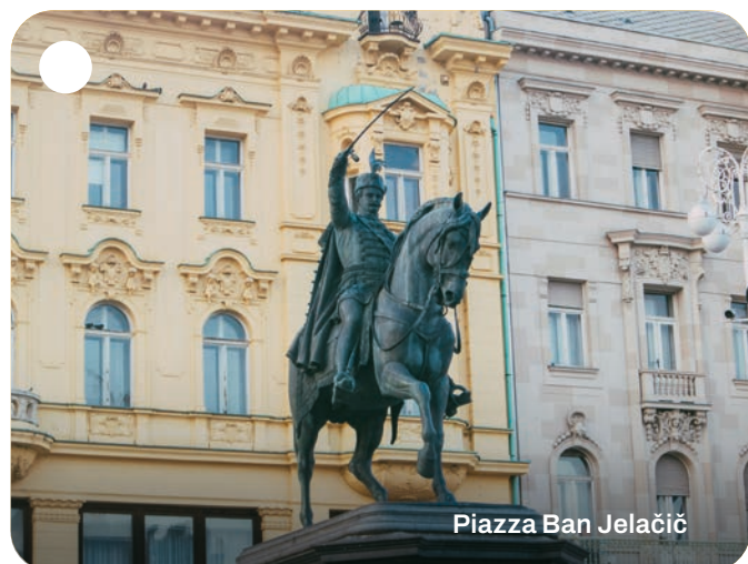
Piazza Ban Jelačić