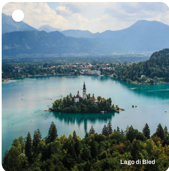
Lago di Bled